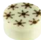
42 PALET DES NEIGES Mus malinowy z dodatkiem brandy w białej czekoladzie