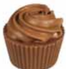
45 DIABLOTIN LAIT Czysty krem z orzechów laskowych, udekorowany kremem Gianduja