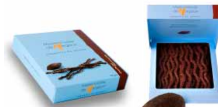
● Ciemna czekolada, 125g netto nr ref. 0607-PL