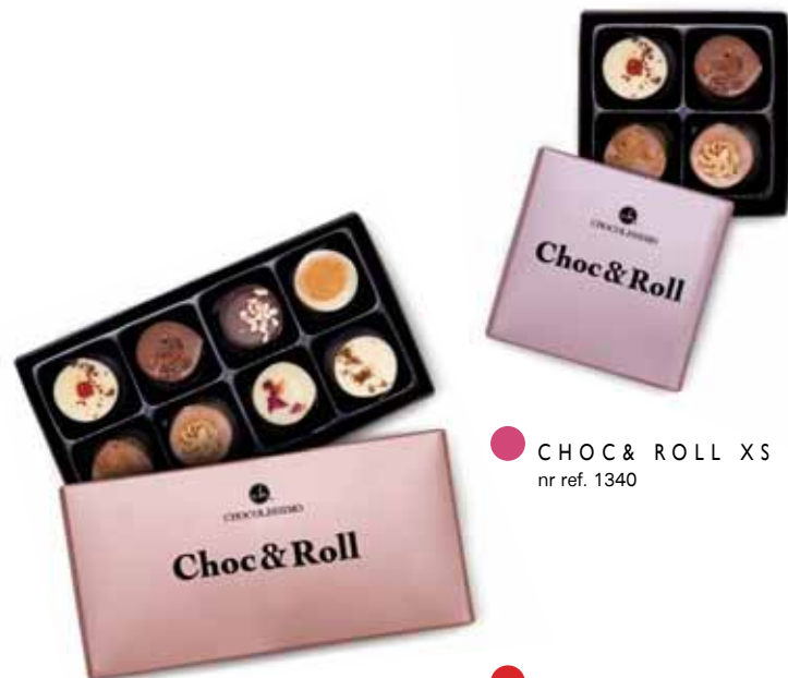
● CHOC & ROLL XS nr ref. 1340

Niektóre rzeczy, zmieniają świat na zawsze. Choc&Roll powstały po to, by już nigdy o czekoladzie nie pomyśleć w kategoriach nudy. Przepysznie wykonane, tradycyjne receptury, zamknęliśmy w przezroczystym płaszczu, tak, aby móc zobaczyć jak wyglądają nasze pralinki od środka. Nie tylko ich widok jest ponętny. Ich smak zniwala! Dostępne w opakowaniach zbiorczych oraz jako gotowy produkt.