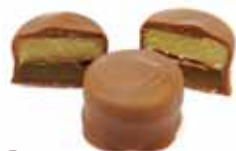
33 TATIN pasta migdałowa z kawałkami jabłek wymieszana z karmelem i Calvadosem – w mlecznej czekoladzie