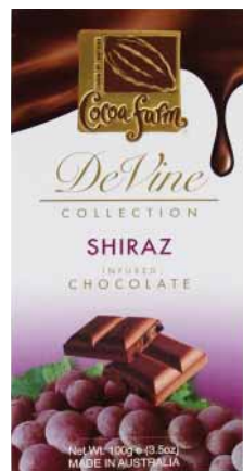
CZEKOLADA WINNA SHIRAZ Masa netto 100g, opakowanie zbiorcze: 10 szt. nr ref. 1032-PL