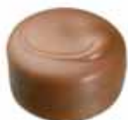
37 VALLAURIS Pyszna marcepanowa pasta z dodatkiem pomarańczy w mlecznej czekoladzie