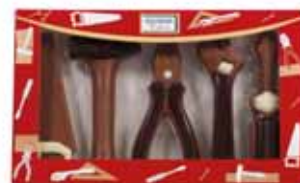
ZESTAW NARZĘDZI nr ref. 3075-HE