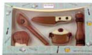
ZESTAW NARZĘDZI KUCHENNYCH nr ref. 3076-HE