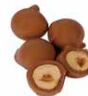
● CHOCO&NUTS Masa netto: 5g Opakowanie zbiorcze: 1kg nr ref. PP-NU0804