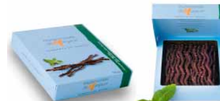
● Mięta i ciemna czekolada, 125g netto nr ref. 0603-PL