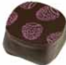
40 PULPEO Nadzenie z malin zamknięte w deserowej czekoladzie