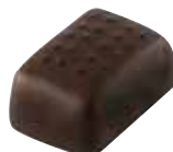
48 VAYA Pyszna pomarańczowa pasta obłana deserową czekoladą