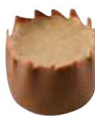
39 JERICO Ciemna czekolada 72% wypełniona kremem Gianduja z wanilią