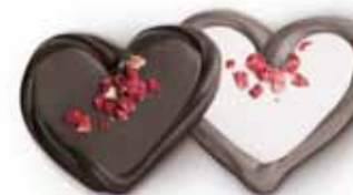
● CZEKOLADOWE SERCA Masa netto 1 szt.: 12g Opakowanie zbiorcze: koszyczek 2kg Nr ref. PP-402001