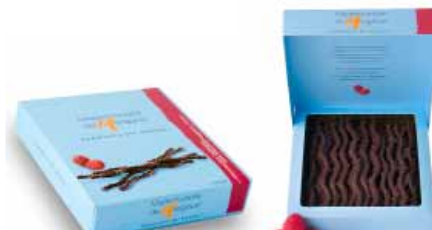
● Maliny i ciemna czekolada, 125g netto nr ref. 0608-PL