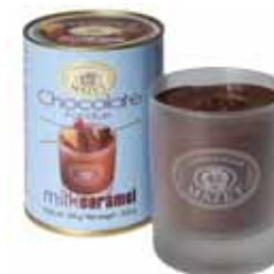
FONDUE W SZKLANYM KUBKU, MLECZNA Z KARMELEM Masa netto: 300g opakowanie zbiorcze: 12 szt. nr ref. 0503