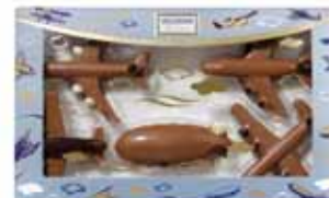
ZESTAW SAMOLOTÓW nr ref. 3070-HE

Dostępne są również zestawy: konny, rowerowy, farmerski, zoo, figurki szczęścia. Wszystkie zestawy mają masę netto: 100g. Opakowanie zbiorcze zawiera 11 szt.