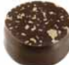
47 ADELITE Pasta orzechowa w ciemnej czekoladzie