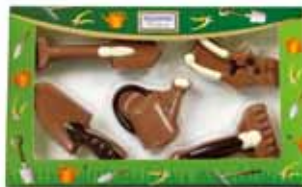
ZESTAW NARZĘDZI OGRODOWYCH nr ref. 3074-HE