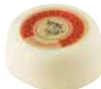
46 PETIT CAMEMBERT Marcepan z cząstkami jabłka i calvadosem