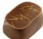
38 TURINO Doskonała pasta Gianduja z wanilią w mlecznej czekoladzie