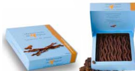
● Cappucino i mleczna czekolada, 125g netto nr ref. 0604-PL