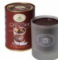
FONDUE W SZKLANYM KUBKU, DESEROWA Masa netto: 300g opakowanie zbiorcze: 12 szt. nr ref. 0505