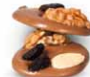
● BACALETTE Masa netto 1 szt.: 15g Opakowanie zbiorcze: 1kg nr ref. PP-BA0806