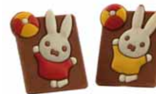
● MIFFY Masa netto 1 szt.: 12g Opakowanie zbiorcze: karton 1,5kg nr ref. PP-011012