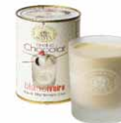
FONDUE W SZKLANYM KUBKU, BIAŁA CZEKOLADA Masa netto: 300g opakowanie zbiorcze: 12 szt. nr ref. 0507