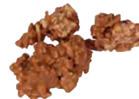
● ALMONDINES Masa netto 1 szt.: 16g Opakowanie zbiorcze: 1,2kg nr ref. PP-AL0805