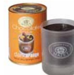
FONDUE W SZKLANYM KUBKU, DESEROWA Z POMARAŃCZĄ Masa netto: 300g opakowanie zbiorcze: 12 szt. nr ref. 0504