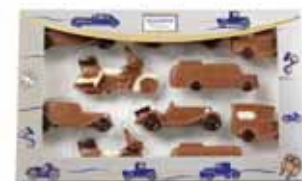
ZESTAW MOTORYZACYJNY nr ref. 3072-HE