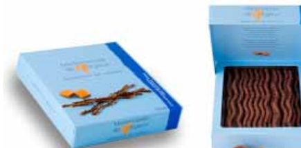
● Karmel i mleczna czekolada, 125g netto nr ref. 0601-PL