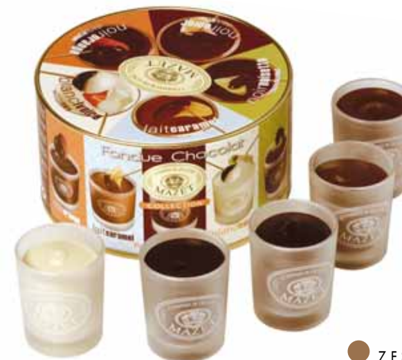
ZESTAW FONDUE Masa netto: 300g opakowanie zbiorcze: 10 szt. nr ref. 0508

Dostępne są również zestawy: konny, rowerowy, farmerski, zoo, figurki szczęścia. Wszystkie zestawy mają masę netto: 100g. Opakowanie zbiorcze zawiera 11 szt.