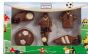
ZESTAW PIŁKARSKI nr ref. 3073-HE