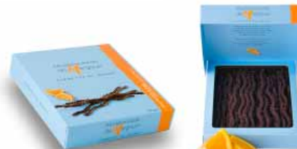
● Pomarańcze i ciemna czekolada, 125g netto nr ref. 0602-PL

To co najlepsze we francuskim czekoladowym rzemiośle: delikatne gałazki stworzone przez Mademoiselle de Margaux. Choć przepis na te oryginalne smakołyki wydaje się być prosty, ich smak potwierdza, jak ważna jest jakość składników dla uzyskania najlepszego efektu końcowego. Produkcja Mademoiselle de Margaux to połączenie francuskiej tradycji i inspiracji, które płyną z całego świata. Teraz dzięki Chocollissimo mogą się Państwo przekonać, że Francja to nie tylko doskonałe wina i sery, lecz również czekolada!