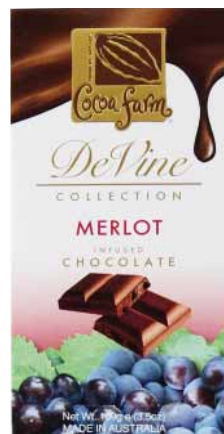
CZEKOLADA WINNA MERLOT Masa netto 100g, opakowanie zbiorcze: 10 szt. nr ref. 1031-PL