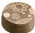
41 OPHITE Pyszny karmelowy krem w mlecznej czekoladzie