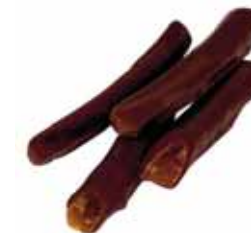
● ORANGETTES Masa netto: 6g Opakowanie zbiorcze: 1kg nr ref. PP-OR0803