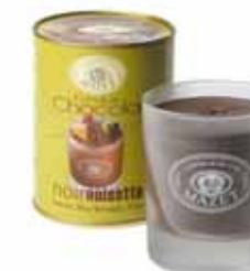
FONDUE W SZKLANYM KUBKU, ORZECHOWA MLECZNA Masa netto: 300g opakowanie zbiorcze: 12 szt. nr ref. 0506