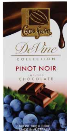
CZEKOLADA WINNA PINOT NOIR Masa netto 100g, opakowanie zbiorcze: 10 szt. nr ref. 1030-PL