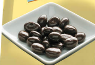
Perły z Medoc