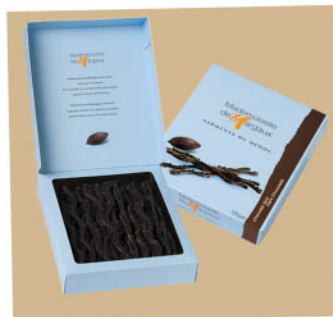
Deserowe, gorzkie Nr ref. 0607