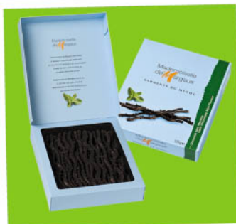
Deserowo-miętowe Nr ref. 0603