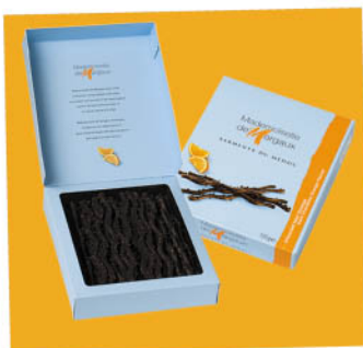
Deserowo-pomarańczowe Nr ref. 0602