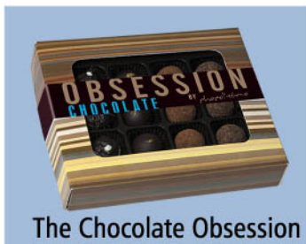
The Chocolate Obsession