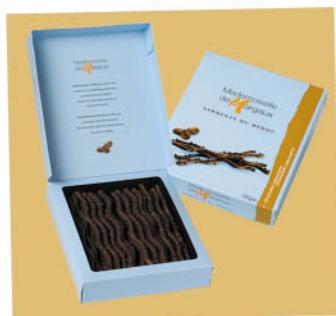
Mleczno-kawowe Nr ref. 0604