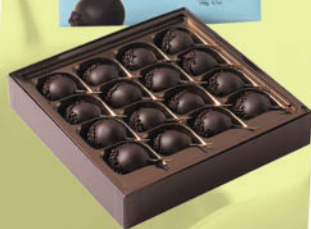
Winne grona w czekoladzie