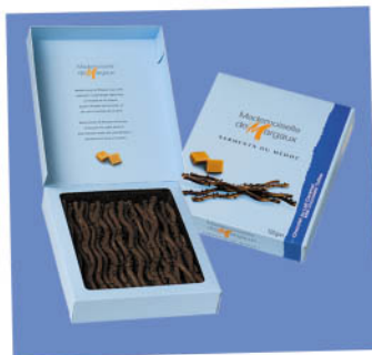
Mleczno-karmelowe Nr ref. 0601

... to co najlepsze we francuskim czekoladowym rzemiośle: delikatne, mleczne, czekoladowe gałązki lub te deserowe stworzone przez Mademoiselle de Margaux. Choć przepis na te oryginalne smakołyki wydaje się być prosty, ich smak potwierdza, jak ważna jest najwyższa jakość składników dla uzyskania najlepszego efektu końcowego. Produkcję Mademoiselle de Margaux to połączenie francuskiej tradycji i inspiracji, które płyną z całego świata. Teraz dzięki chocolissimo mogą się Państwo przekonać, że Francja to nie tylko doskonałe wina i sery, lecz również czekolada!