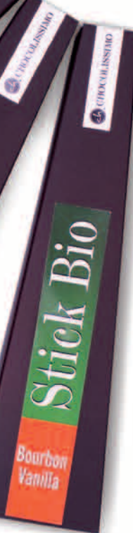
VANILLA Nr ref. 5074