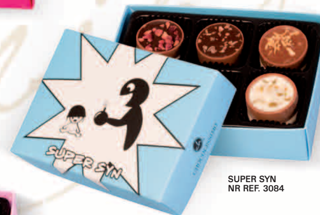
SUPER SYN NR REF. 3084