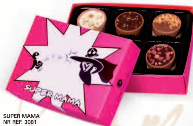
SUPER MAMA NR REF. 3081