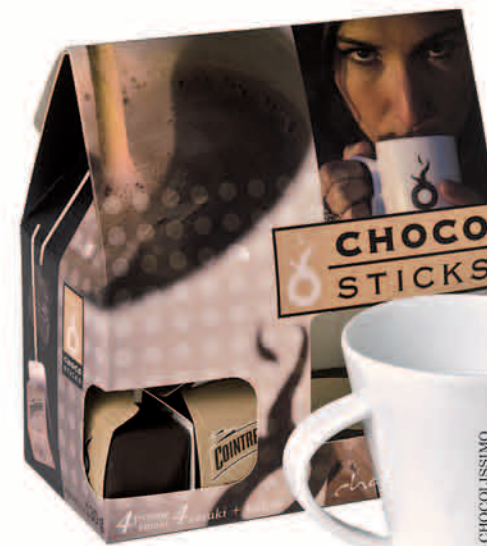
CHOCO STICKS&CUP Czekolada do picia na patyku w czterech smakach z kubkiem Chocolissimo. 4 sztuki+kubek, waga netto: 130g. Wymiary: 160x120x60mm Nr ref. 1803