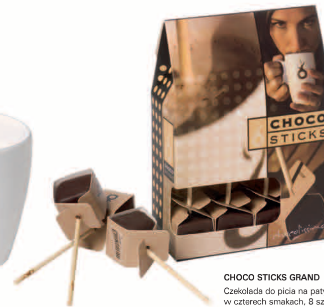
CHOCO STICKS GRAND Czekolada do picia na patyku w czterech smakach, 8 sztuk, waga netto 260g Wymiary: 160x120x60mm Nr Ref. 1802