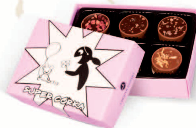
SUPER CÓRKA NR REF. 3083