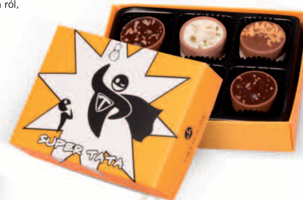
SUPER TATA NR REF. 3082

Zestawy zawierają sześć ręcznie robionych czekoladek o łącznej wadze netto min. 70g w pudełkach o wymiarach 130x95x32mm.