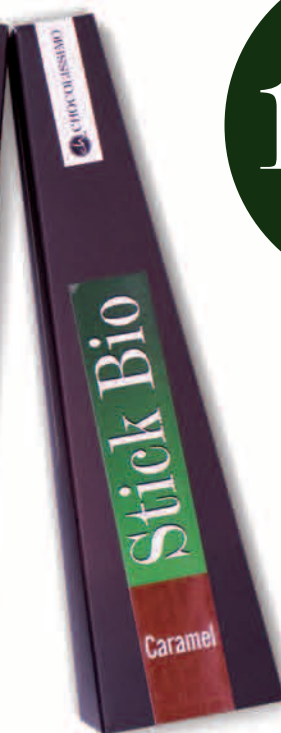
CARAMEL Nr ref. 5075