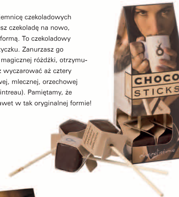
CHOCO STICKS PETIT Czekolada do picia na patyku w czterech smakach, 4 sztuki, waga netto 130g Wymiary: 160x60x60mm Nr Ref. 1801

Jeśli wydaje Ci się, że już rozgryzłeś tajemnicę czekoladowych doznań, sięgnij po Choco Sticks. Odkryjesz czekoladę na nowo, ponieważ nasze Choco Sticks zaskakują formą. To czekoladowy sześcian umieszczony na poręcznym patyczku. Zanurzasz go w gorącym mleku... i jak za dotknięciem magicznej różdżki, otrzymujesz przepyszną pitną czekoladę. Możesz wyczarować aż cztery różne smaki: czekolady ciemnej, deserowej, mlecznej, orzechowej i pomarańczowej (z dodatkiem likieru Cointreau). Pamiętamy, że tradycja dobrego smaku zobowiązuje, nawet w tak oryginalnej formie!