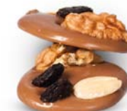
BACALETTE Masa netto 1 szt.: 15g Opakowanie zbiorcze: 1kg Nr ref. PP-BA0806