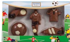
ZESTAW PIŁKARSKI Nr ref. 3073-HE