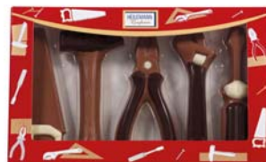
ZESTAW NARZĘDZI Nr ref. 3075-HE