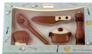
ZESTAW NARZĘDZI KUCHENNYCH Nr ref. 3076-HE