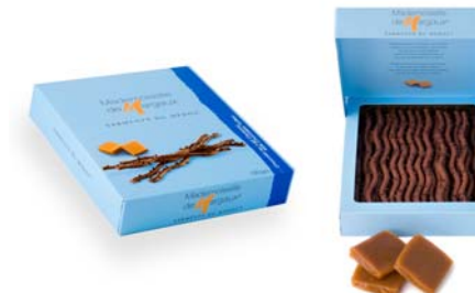
Karmel i mleczna czekolada, 125g netto Opakowanie zbiorcze: 12 szt. Nr ref. 0601-PL