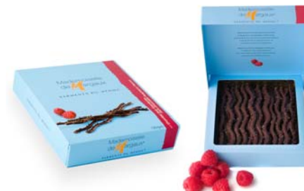
Maliny i ciemna czekolada, 125g netto Opakowanie zbiorcze: 12 szt. Nr ref. 0608-PL