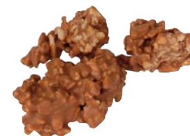
ALMONDINES Masa netto 1 szt.: 16g Opakowanie zbiorcze: 1,2kg Nr ref. PP-AL0805