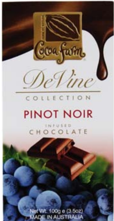
CZEKOLADA WINNA PINOT NOIR Masa netto: 100g Opakowanie zbiorcze: 12 szt. Nr ref. 1030-PL