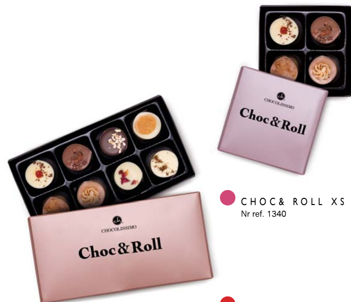
CHOC & ROLL XS Nr ref. 1340

Niektóre rzeczy, zmieniają świat na zawsze. Choc&Roll powstały po to, by już nigdy o czekoladzie nie pomyśleć w kategoriach nudy. Przepysznie wykonane, tradycyjne receptury, zamknęliśmy w przezroczystym płaszczu, tak, aby móc zobaczyć jak wyglądają nasze pralinki od środka. Nie tylko ich widok jest ponętny. Ich smak zniewala! Dostępne w opakowaniach zbiorczych oraz jako gotowy produkt.