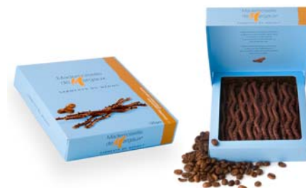
Cappucino i mleczna czekolada, 125g netto Opakowanie zbiorcze: 12 szt. Nr ref. 0604-PL