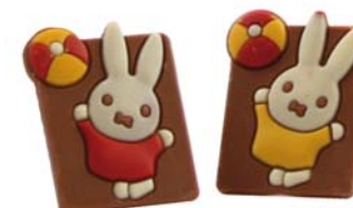
MIFFY Masa netto 1 szt.: 12g Opakowanie zbiorcze: karton 1,5kg Nr ref. PP-011012