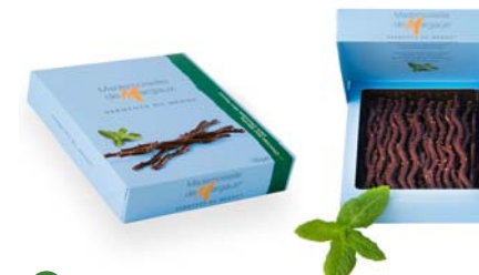
Mięta i ciemna czekolada, 125g netto Opakowanie zbiorcze: 12 szt. Nr ref. 0603-PL