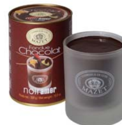
FONDUE W SZKLANYM KUBKU, DESEROWA Masa netto: 300g Opakowanie zbiorcze: 10 szt. Nr ref. 0505