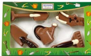
ZESTAW NARZĘDZI OGRODOWYCH Nr ref. 3074-HE