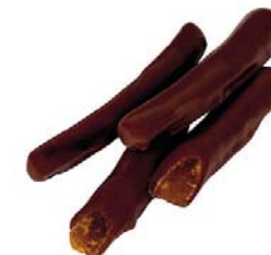
ORANGETTES Masa netto: 6g Opakowanie zbiorcze: 1kg Nr ref. PP-OR0803