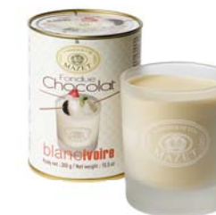
FONDUE W SZKLANYM KUBKU, BIAŁA CZEKOLADA Masa netto: 300g Opakowanie zbiorcze: 10 szt. Nr ref. 0507