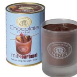
FONDUE W SZKLANYM KUBKU, MLECZNA Z KARMELEM Masa netto: 300g Opakowanie zbiorcze: 10 szt. Nr ref. 0503