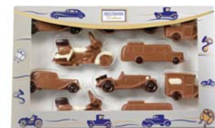
ZESTAW MOTORYZACYJNY Nr ref. 3072-HE