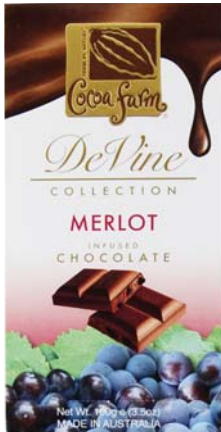
CZEKOLADA WINNA MERLOT Masa netto: 100g Opakowanie zbiorcze: 12 szt. Nr ref. 1031-PL