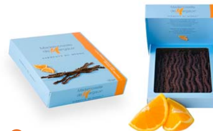
Pomarańcze i ciemna czekolada, 125g netto Opakowanie zbiorcze: 12 szt. Nr ref. 0602-PL

To co najlepsze we francuskim czekoladowym rzemiośle: delikatne gałązki stworzone przez Mademoiselle de Margaux. Choć przepis na te oryginalne smakołyki wydaje się być prosty, ich smak potwierdza, jak ważna jest jakość składników dla uzyskania najlepszego efektu końcowego. Produkcja Mademoiselle de Margaux to połączenie francuskiej tradycji i inspiracji, które płyną z całego świata. Teraz dzięki Chocollissimo mogą się Państwo przekonać, że Francja to nie tylko doskonałe wina i sery, lecz również czekolada!