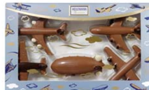
ZESTAW SAMOLOTÓW Nr ref. 3070-HE

Dostępne są również zestawy: konny, rowerowy, farmerski, zoo, figurki szczęścia. Wszystkie zestawy mają masę netto: 100g. Opakowanie zbiorcze zawiera 11 szt.