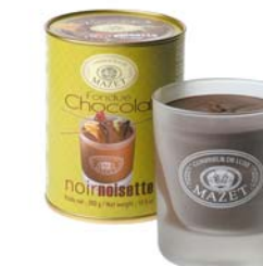
FONDUE W SZKLANYM KUBKU, ORZECHOWA MLECZNA Masa netto: 300g Opakowanie zbiorcze: 10 szt. Nr ref. 0506