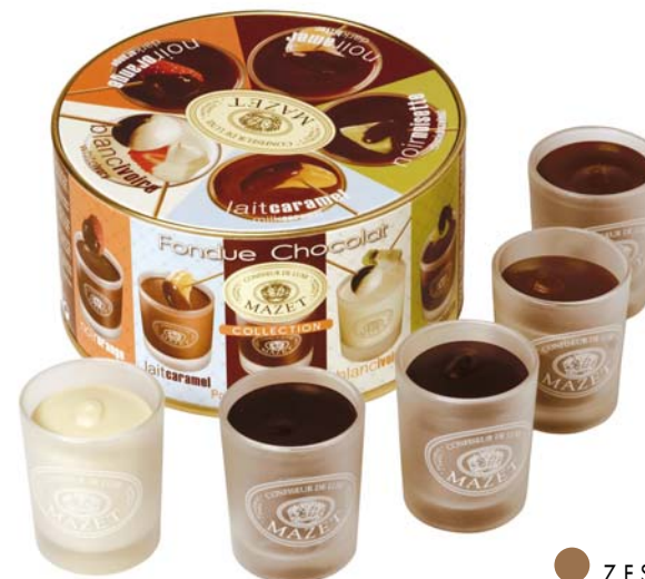
ZESTAW FONDUE Masa netto: 5x45g Opakowanie zbiorcze: 6 szt. Nr ref. 0508

Dostępne są również zestawy: konny, rowerowy, farmerski, zoo, figurki szczęścia. Wszystkie zestawy mają masę netto: 100g. Opakowanie zbiorcze zawiera 11 szt.