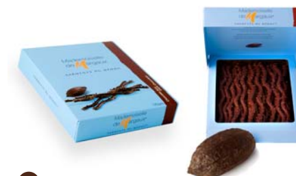
Ciemna czekolada, 125g netto Opakowanie zbiorcze: 12 szt. Nr ref. 0607-PL