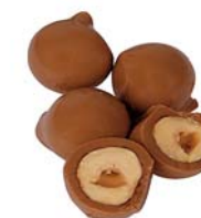
CHOCO&NUTS Masa netto: 5g Opakowanie zbiorcze: 1kg Nr ref. PP-NU0804