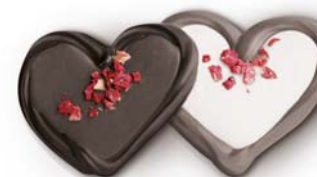
CZEKOLADOWE SERCA Masa netto 1 szt.: 12g Opakowanie zbiorcze: koszyczek 2kg Nr ref. PP-402001