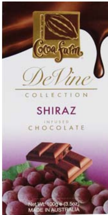
CZEKOLADA WINNA SHIRAZ Masa netto: 100g Opakowanie zbiorcze: 12 szt. Nr ref. 1032-PL