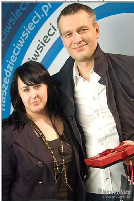
Fot. 1 Chocolissimo w doborowym towarzystwie

Poniżej prezentujemy zdjęcia z planu, dzięki uprzejmości Studia Newcolors.