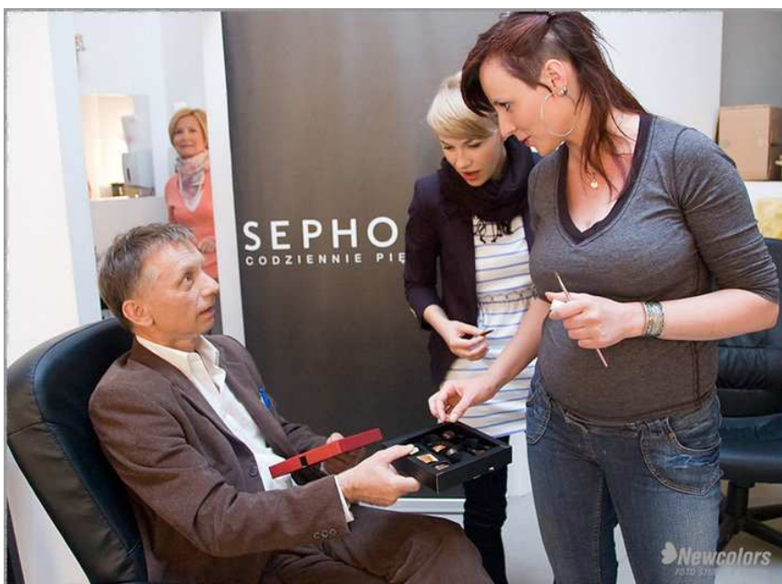
Fot. 7 Pralinki chocolissimo znikają z opakowań w błyskawicznym tempie