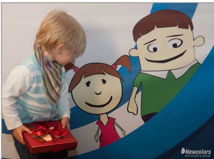
Fot. 3 Przede wszystkim dzieci