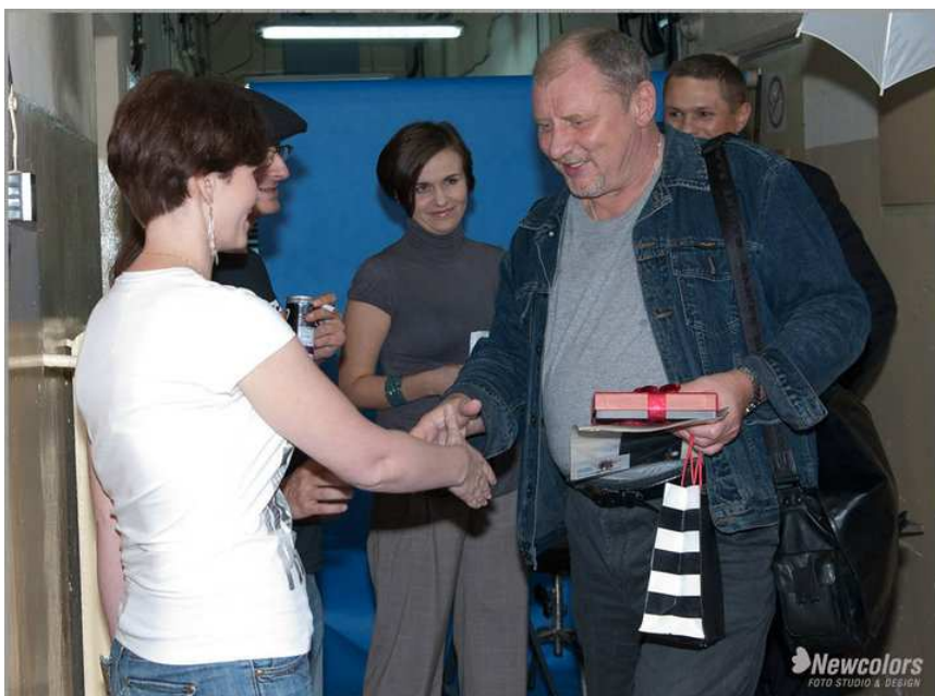
Fot. 6 Czekoladowe podziękowanie