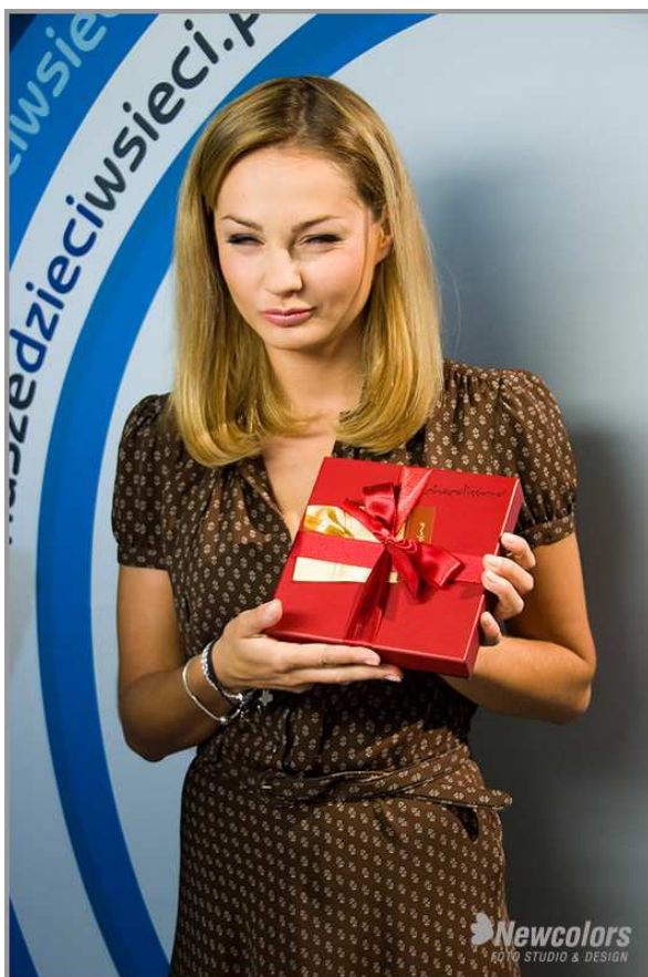
Fot. 2 Czekoladki kochają wszyscy