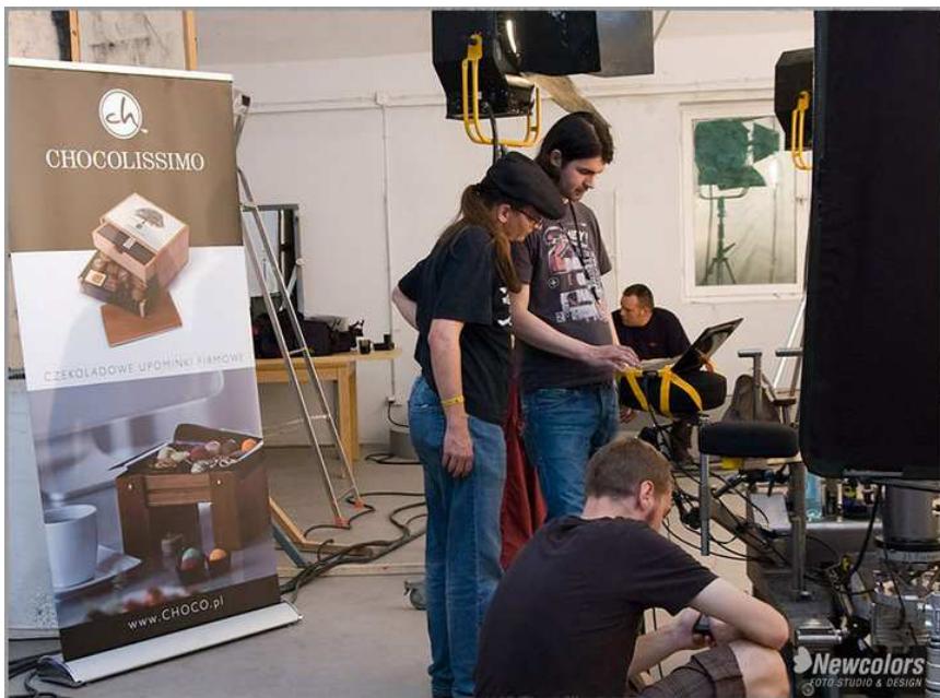
Fot. 5 Chocollissimo na planie