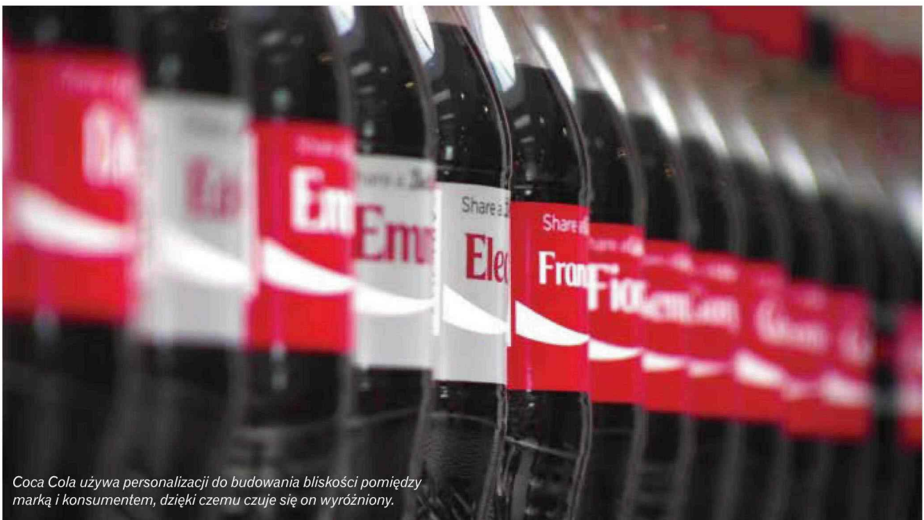
Coca Cola używa personalizacji do budowania bliskości pomiędzy marką i konsumentem, dzięki czemu czuje się on wyróżniony.

Jak wykorzystać modę na indywidualizm, jednocześnie zaspokajając potrzeby wszystkich klientów? To pytanie spędza sen z powiek nie tylko specjalistom od reklamy, ale i producentom. Badania pokazują, że przeciętny konsument potrzebuje od 3 do 7 sekund, by wybrać odpowiedni produkt z półki. Oczywiście, ten wybór często zdeterminowany jest przez dotychczasowe doświadczenia i preferencje. Mimo to czasem konsument chce spontanicznie zdecydować się na coś nowego, i tutaj opakowanie „wchodzi do gry”.